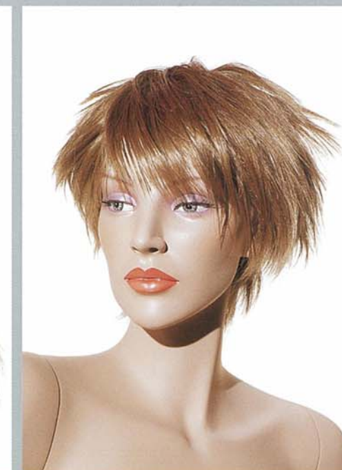
KATE 4V スタンダードメイク C・カツラ (オーダーサンプル)