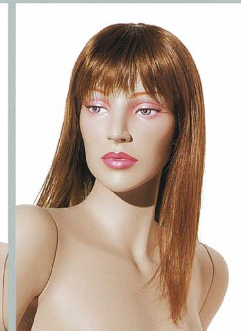
KATE 4V スタンダードメイク E・カツラ (No.204 B)