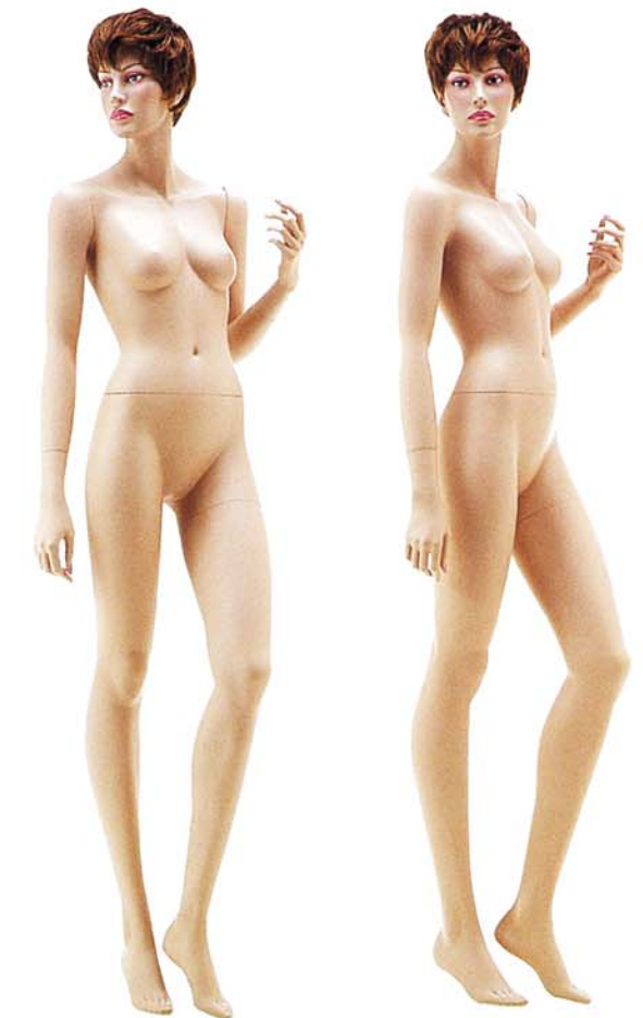
KATE 2V(B) 高さ 178.0 / B 80.0 / W 59.0 / H 87.0 カツラ No.201B 右腕 KATE 2B / 右手先 PW 16 左腕 KATE 2B / 左手先 PW B