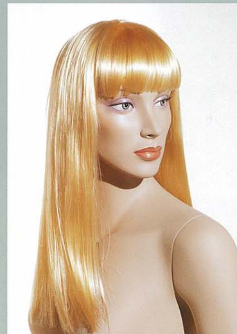
KATE 3V スタンダードメイク D・カツラ (オーダーサンプル)