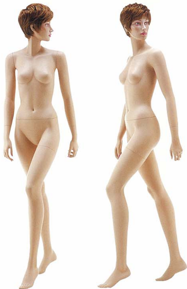
KATE 3V 高さ 177.0 / B 78.0 / W 58.5 / H 86.0 カツラ No.201B 右腕 KATE 3 / 右手先 PW D 左腕 KATE 3 / 左手先 PW D