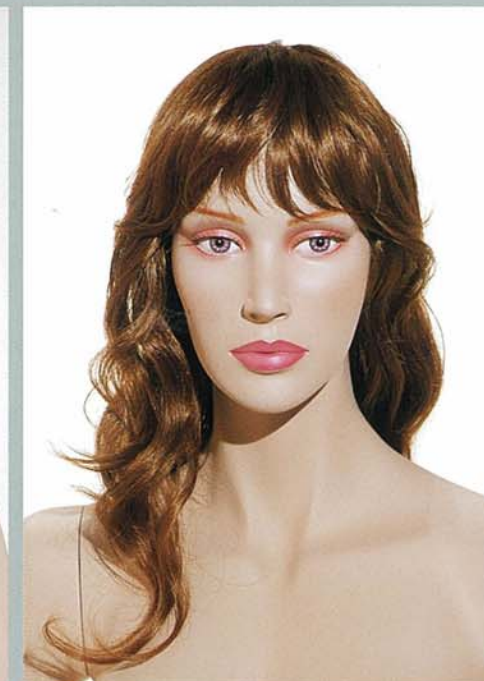
KATE 1V スタンダードメイク E・カツラ (No.203 B)