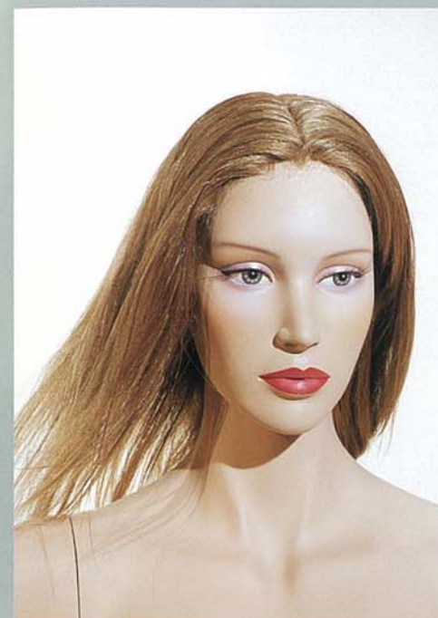
KATE 1V スタンダードメイク A・カツラ (オーダーサンプル)

スタンダード仕様のメイクとカツラは通常レンタル料金に含まれています。オーダーサンプルのカツラは仕上げの一例です。ご注文に応じてご希望のメイクとカツラの制作を、別途料金にて承っておりますのでご相談ください。