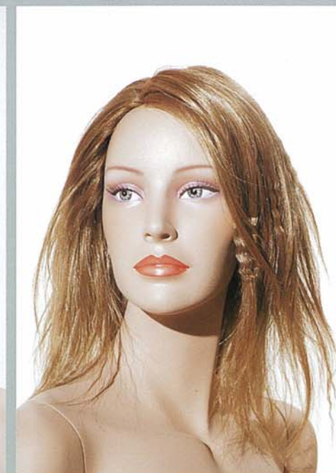
KATE 2V スタンダードメイク B・カツラ (オーダーサンプル)