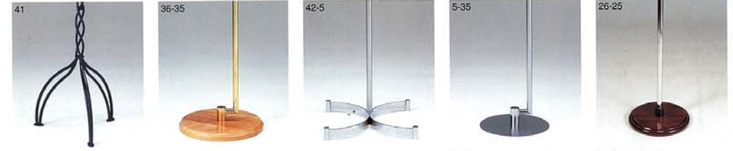
S-41 スチールメラミン焼付塗装 S-36 木 生地CL S-35SG スチールGメッキ S-42 スチールCrメッキ S-55 スチールCrメッキ S-5 スチールCrメッキサンドブラスト S-35SC スチールCrメッキ S-26 木 染色茶 S-25S スチールCrメッキ