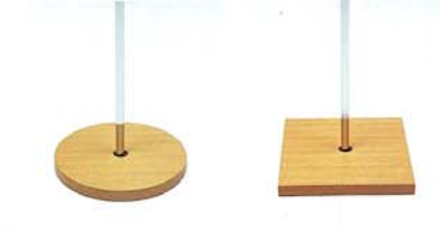
S-54 木 生地CL S-55 木 生地CL