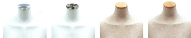
H-45 アルミ H-44 ステンレスHL H-42 木 生地CL H-43 木 生地CL