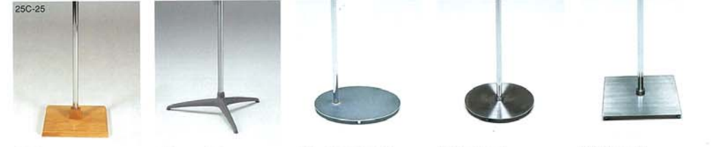
S-25C 木 生地CL S-25S スチールCrメッキ S-46 スチール塗装 480φ S-51 ステンレス サンドブラスト S-52 ステンレスHL S-53 ステンレスHL