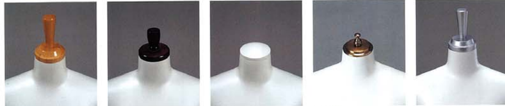
H-23 木 生地CL H-24 木 染色茶 H-20 木 ラッカー塗装 H-25 真鍮 H-23(L) 木 ラッカー塗装