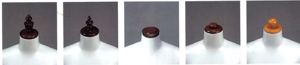
H-21 木 染色茶 H-22 木 染色茶 H-18 木 染色茶 H-19 木 染色茶 H-11 木 生地CL