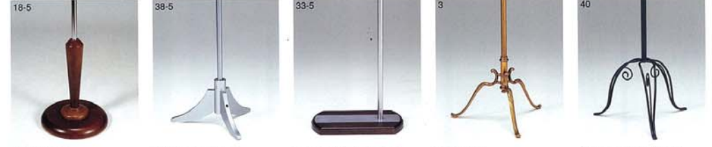
S-18 木 染色茶 S-55 スチールCrメッキ S-38 木 ラッカー塗装 S-55 スチールCrメッキ S-33 木 染色茶・スチールCrHL S-55 スチールCrメッキ S-3 真鍮飾物 S-40 スチールメラミン焼付塗装