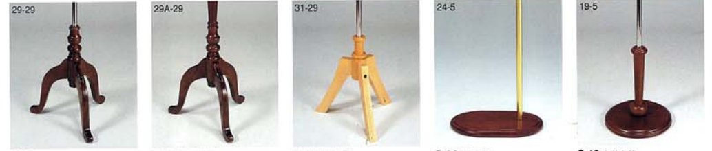
S-29 木 染色茶 S-29S スチールCrメッキ S-29A 木 染色茶 S-29S スチールCrメッキ S-31 木 生地CL S-29S スチールCrメッキ S-24 木 染色茶 S-55G スチールGメッキ S-19 木 染色茶 S-55 スチールCrメッキ