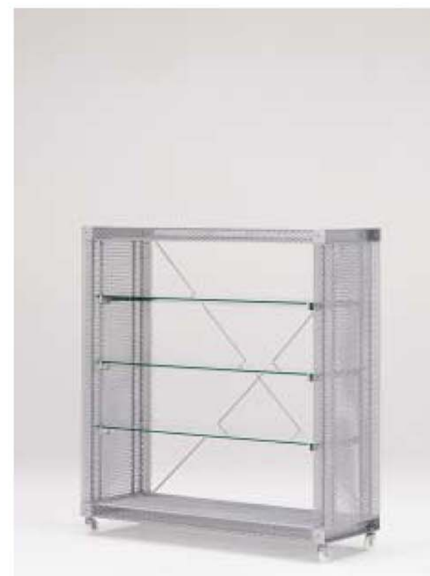
MODEL-6 本体 エキスバンドメタル、プレス・パウダーコート塗装(シルバー) / 棚 透明ガラス8t / 他 スチール・Crメッキ W1325 D450 H1410