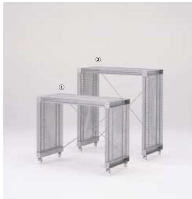
① MODEL-10 W1025 D450 H810 ② MODEL-11 W1025 D450 H1110 本体 エキスパンドメタル、プレス・パウダーコート塗装 (シルバー)