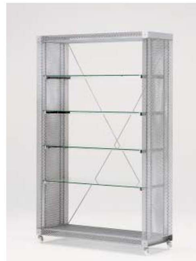
MODEL-4 本体 エキスバンドメタル、プレス・パウダーコート塗装(シルバー) / 棚 透明ガラス8t / 他 スチール・Crメッキ W1325 D450 H2080