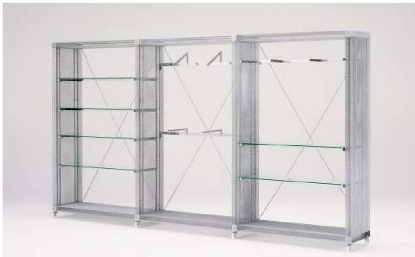
MODEL-1 本体 エキスバンドメタル、プレス・パウダーコート塗装(シルバー) / 棚 透明ガラス8t / ハンガー ステンレス・HL仕上げ / 他 スチール・Crメッキ W3855 D450 H2080