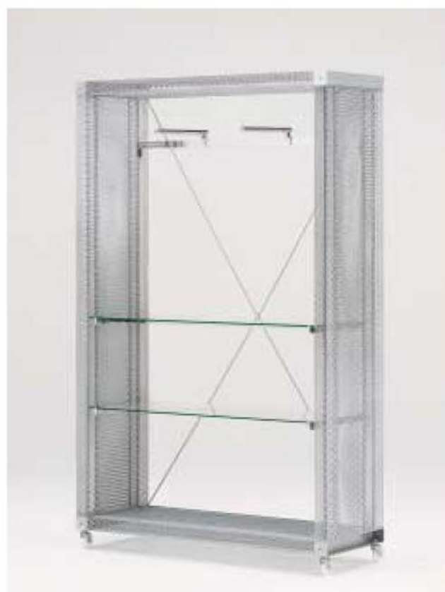
MODEL-3 本体 エキスバンドメタル、プレス・パウダーコート塗装(シルバー) / 棚 透明ガラス8t / ハンガー ステンレス・HL仕上げ / 他 スチール・Crメッキ W1325 D450 H2080