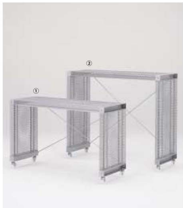
① MODEL-12 W1325 D450 H810 ② MODEL-13 W1325 D450 H1110 本体 エキスパンドメタル、プレス・パウダーコート塗装 (シルバー)