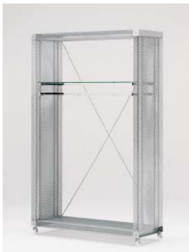
MODEL-2 本体 エキスバンドメタル、プレス・パウダーコート塗装(シルバー) / 棚 透明ガラス8t / ハンガー ステンレス・HL仕上げ / 他 スチール・Crメッキ W1325 D450 H2080