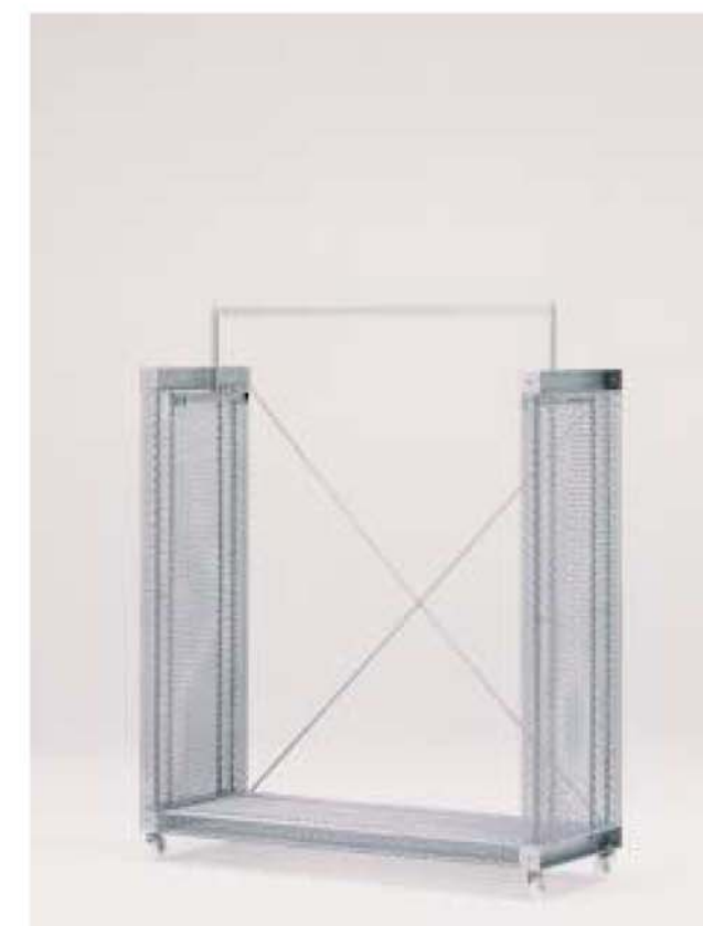
MODEL-7 本体 エキスバンドメタル、プレス・パウダーコート塗装(シルバー) / ハンガー スチール・Crメッキ W1325 D450 H1600