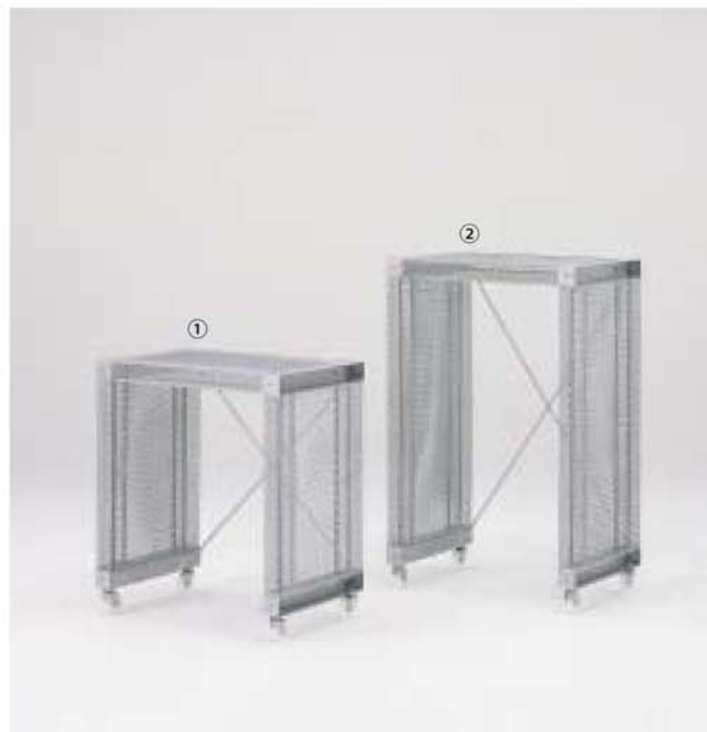
① MODEL-8 W725 D450 H810 ② MODEL-9 W725 D450 H1110 本体 エキスパンドメタル、プレス・パウダーコート塗装 (シルバー)