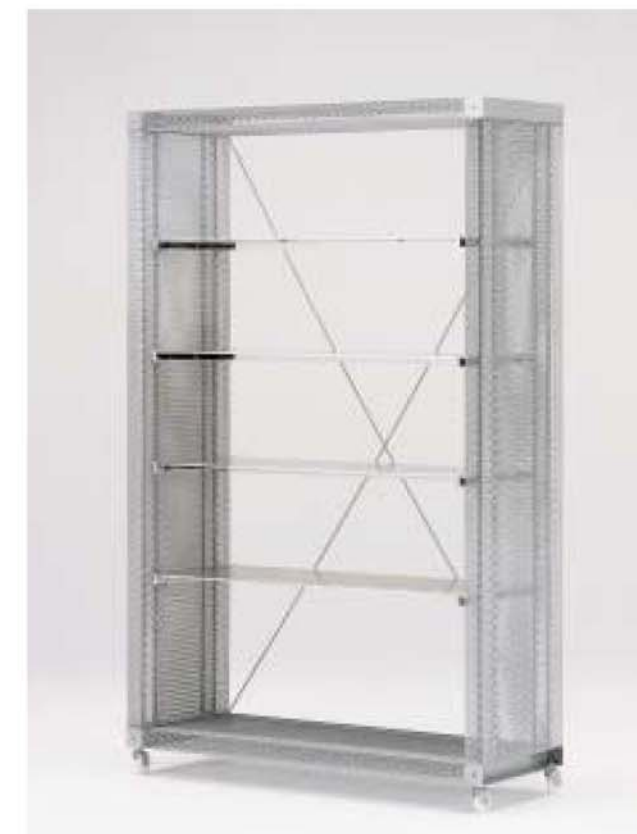
MODEL-5 本体 エキスバンドメタル、プレス・パウダーコート塗装(シルバー) / 棚 アルミプレート5t / 他 スチール・Crメッキ W1325 D450 H2080