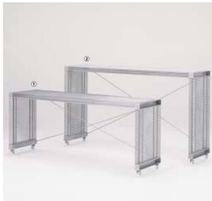
① MODEL-14 W2080 D450 H810 ② MODEL-15 W2080 D450 H1110 本体 エキスパンドメタル、プレス・パウダーコート塗装 (シルバー)