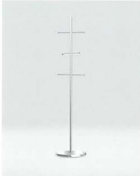
NNB-2 本体 ステンレス・HL仕上げ W400 D400 H1815