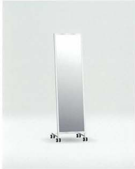
NNB-1 本体 ステンレス・HL仕上げ/ミラー付 W400 D400 H1510