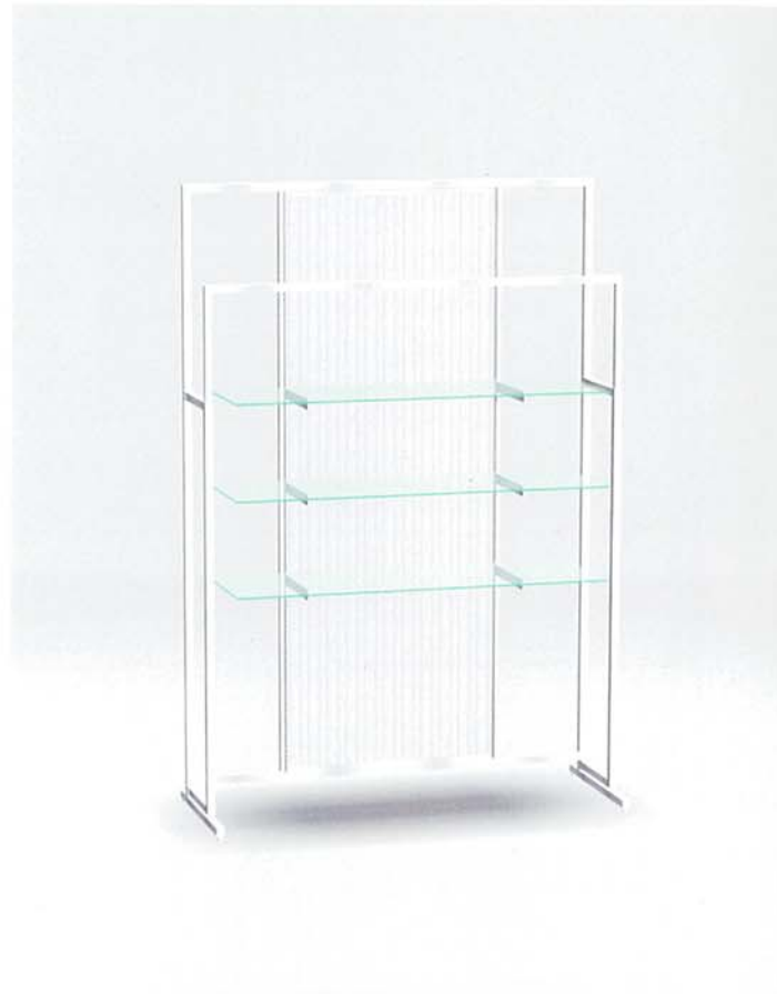
MODEL-4 本体 ステンレス・HL仕上げ/パネル ツインカーボ/棚 透明ガラス8t ハンガー ステンレス・HL仕上げ/他 スチール・Crメッキ W1350 D525 H2000