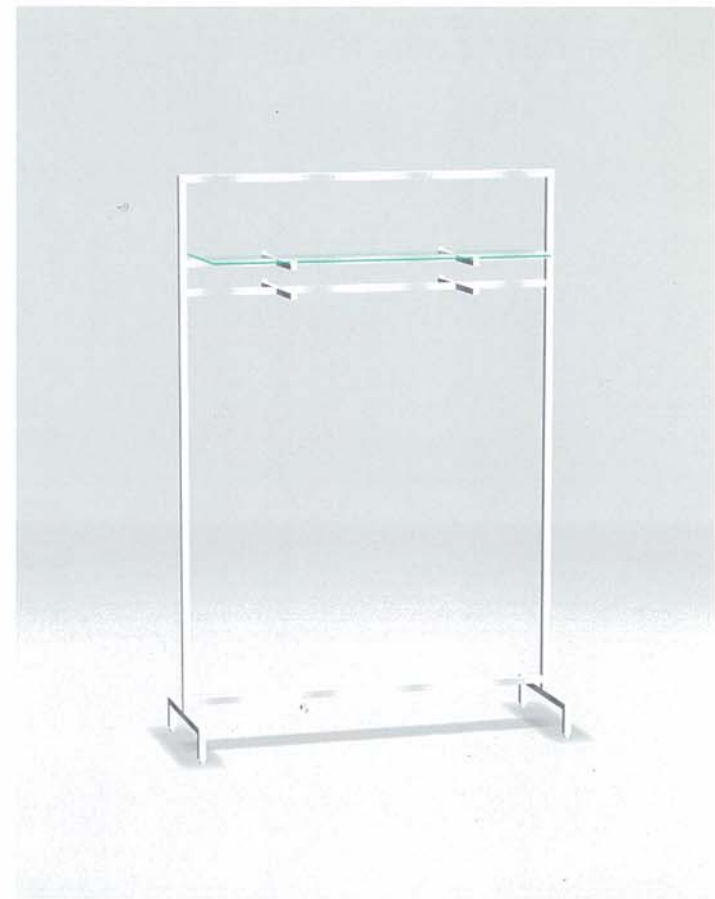
MODEL-1 本体 ステンレス・HL仕上げ/棚 透明ガラス8L/ハンガー ステンレス・HL仕上げ W1350 D500 H2000