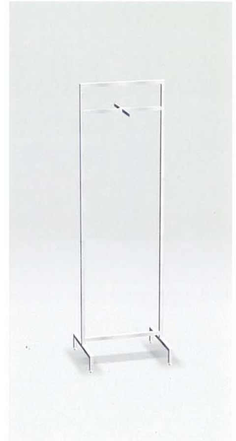
MODEL-7 フェイスアウトハンガー(上図) MODEL-8 一点掛けフック MODEL-9 ハンガー 本体 ステンレス・HL仕上げ W600 D500 H2000