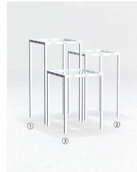
① MODEL-11A W445 D445 H915 ② MODEL-11B W445 D445 H765 ③ MODEL-11C W445 D445 H615 本体 ステンレス・HL仕上げ/ 天板 透明ガラス8t