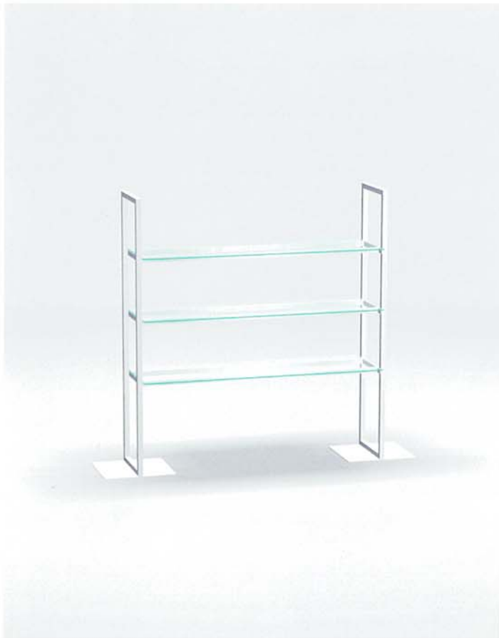
MODEL-5 本体 ステンレス・HL仕上げ/棚 透明ガラス8t/他 スチール・Crメッキ W1579 D400 H1350