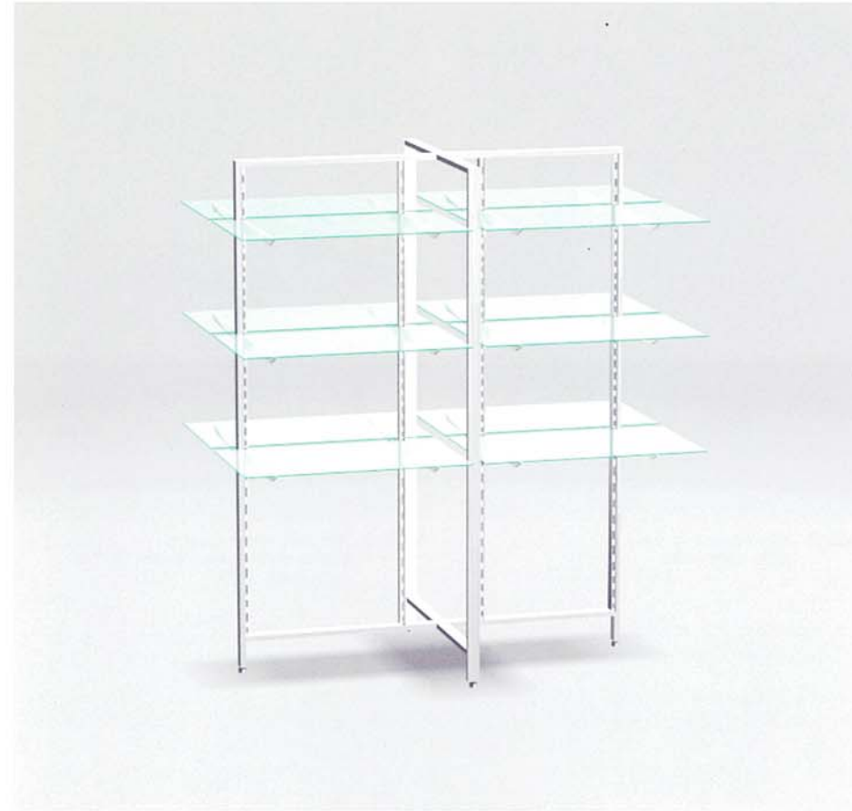
MODEL-13 本体 ステンレス・HL仕上げ/棚 透明ガラス8t/他 スチール・Crメッキ W1232 D832 H1350