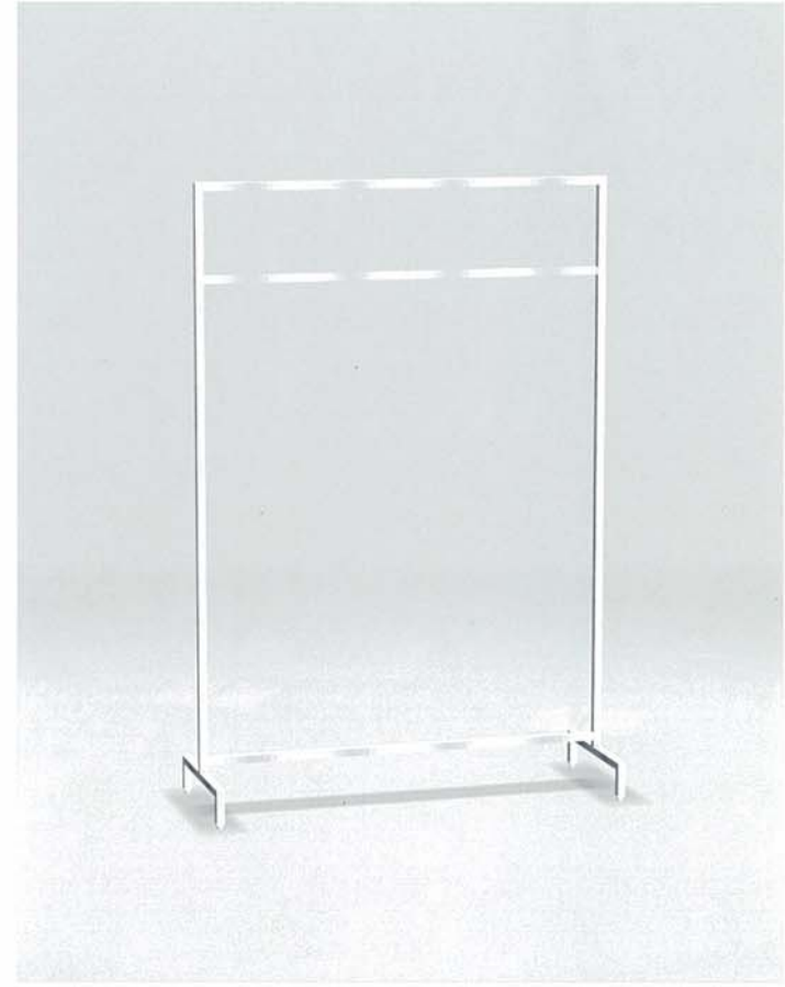
MODEL-2 本体 ステンレス・HL仕上げ/ハンガー ステンレス・HL仕上げ W1350 D500 H2000