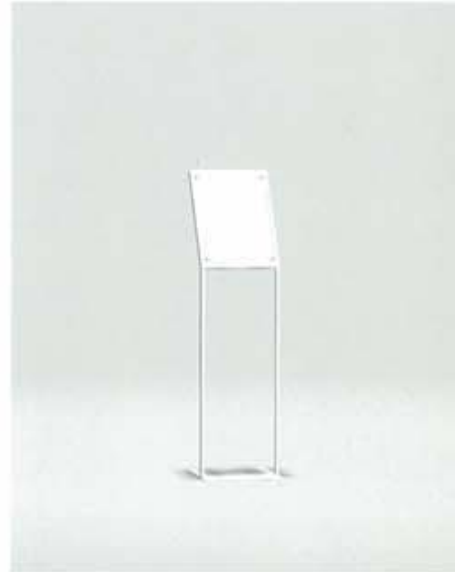
NNB-3 本体 ステンレス・HL仕上げ/ 板面 表・透明アクリル3t 裏・乳半アクリル5t W325 D325 H1250