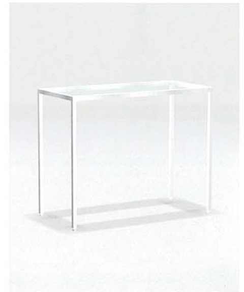
MODEL-12 本体 ステンレス・HL仕上げ/ 天板 透明ガラス8t W945 D445 H765