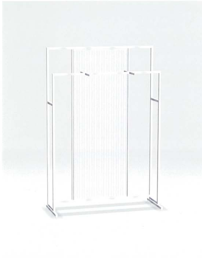
MODEL-3 本体 ステンレス・HL仕上げ/パネル ツインカーボ/ハンガー ステンレス・HL仕上げ W1350 D525 H2000