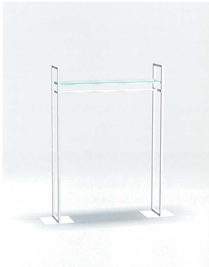
MODEL-6 本体 ステンレス・HL仕上げ/棚 透明ガラス8t/ハンガー ステンレス・HL仕上げ/ 他 スチール・Crメッキ W1579 D400 H1800