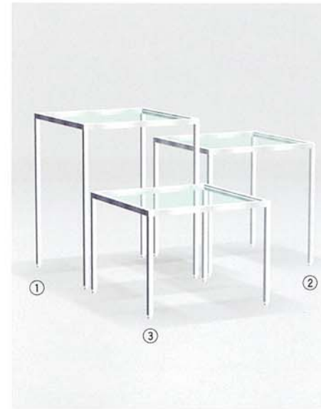
① MODEL-10A W595 D595 H765 ② MODEL-10B W595 D595 H615 ③ MODEL-10C W595 D595 H465 本体 ステンレス・HL仕上げ/ 天板 透明ガラス8t