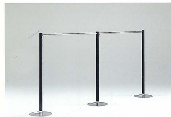
MODEL-1 本体 スチール・塗装 黒/ハンガー スチール・Crメッキ W2900 D400 H1350