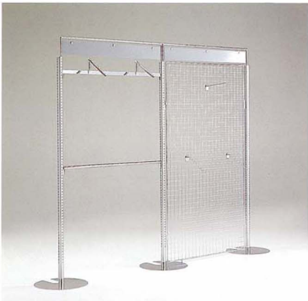
MODEL-9 本体 スチール・Crメッキサンドブラスト/アーチ スチール・GメッキHL アクリルメッシュ スチール・Crメッキ/ハンガー スチール・Crメッキ W3000 D500 H2280