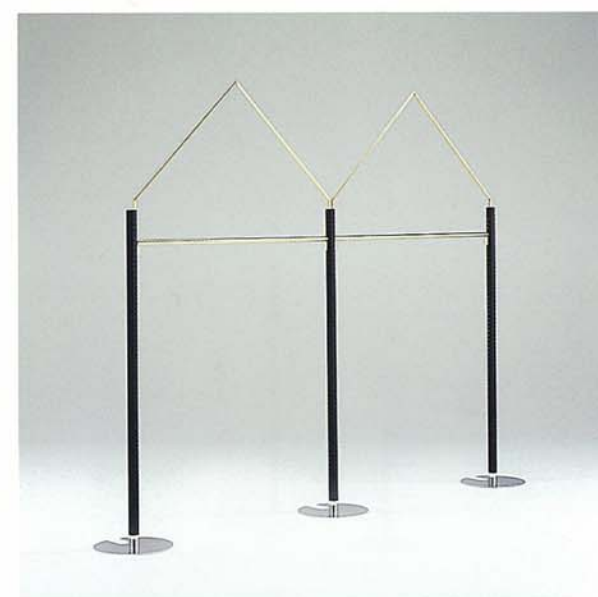
MODEL-2 本体 スチール・塗装 黒/アーチ スチール・GメッキHL/ ハンガー スチール・Gメッキ W2900 D400 H2250