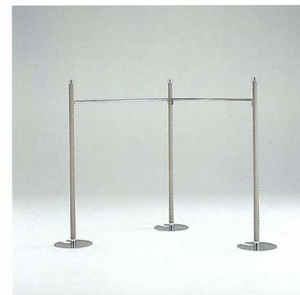
MODEL-5 本体 スチール・塗装 グレー,Crメッキ/ハンガー スチール・Crメッキ W1600 D1600 H1640