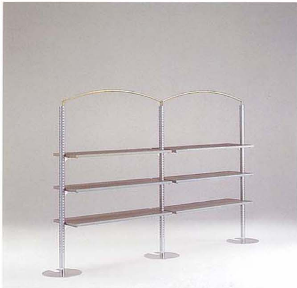
MODEL-8 本体 スチール・Crメッキサンドブラスト/アーチ スチール・GメッキHL アクリル棚 木・染色グレー W2900 D400 H1760