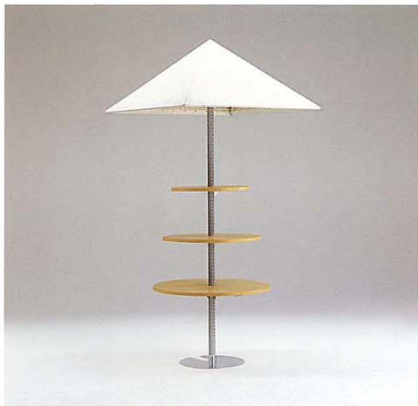
MODEL-14 本体 スチール・塗装 グレー/テント 布/棚 木(栓)・生地CL W900 D900 H2450