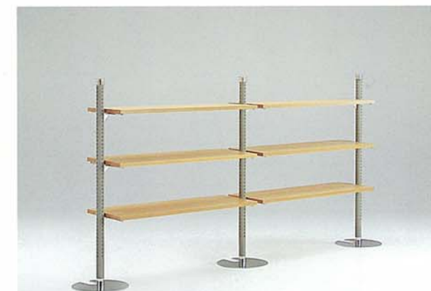
MODEL-4 本体 スチール・塗装 グレー,Gメッキ/棚 木(栓)・生地CL W2900 D400 H1390