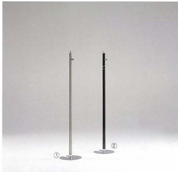
① MODEL-12 本体 スチール・塗装 グレー・Gメッキ/フック スチール・Gメッキ W400 D400 H1840 ② MODEL-13 本体 スチール・塗装 黒・Crメッキ/フック スチール・Crメッキ W400 D400 H1840