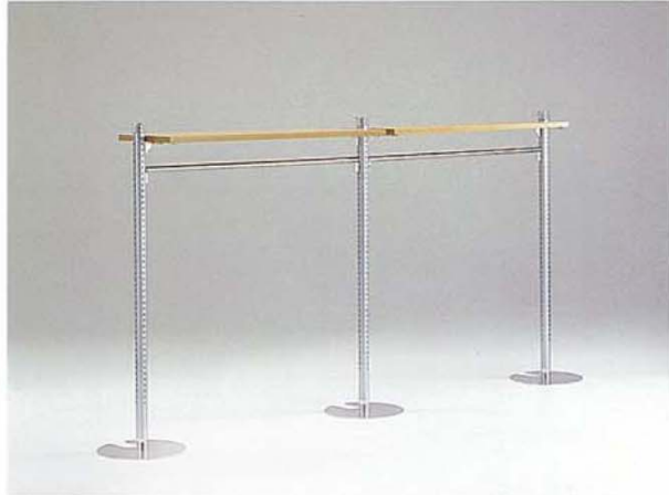
MODEL-7 本体 スチール・Crメッキサンドブラスト・Crメッキ棚 木(栓)・生地CL/ ハンガー スチール・Crメッキ W2900 D400 H1390