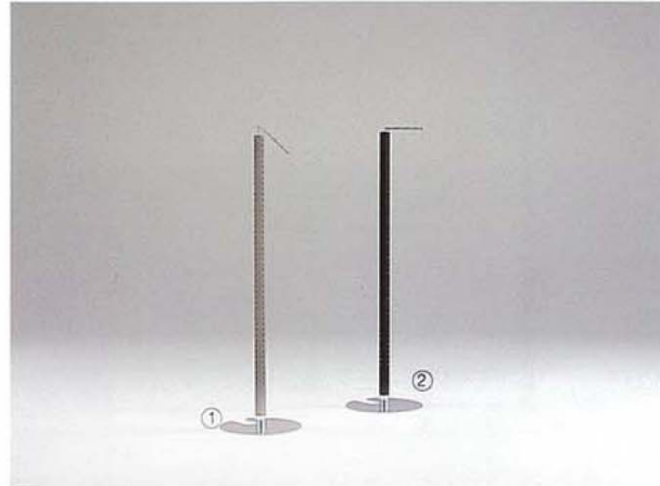
① MODEL-10 本体 スチール・塗装 グレー/フック スチール・CrメッキHL W400 D400 H1400 ② MODEL-11 本体 スチール・塗装 黒/フック スチール・CrメッキHL W400 D400 H1375