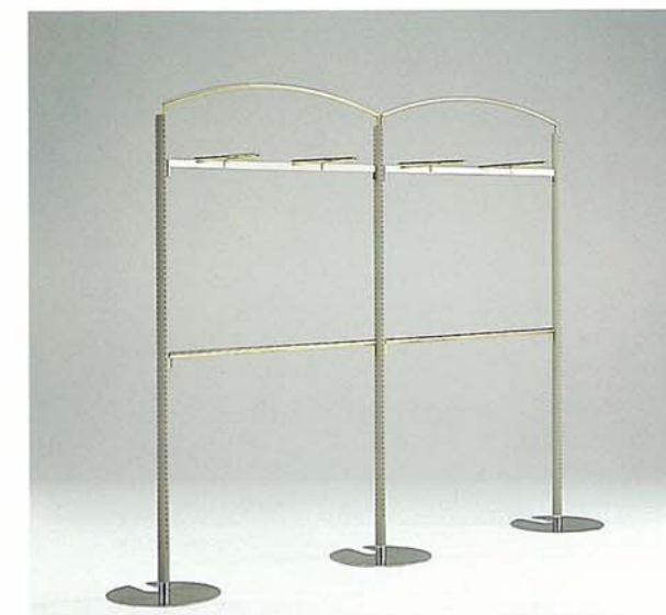
MODEL-6 本体 スチール・塗装 グレー/アーチ スチール・GメッキHL/ ハンガー スチール・Gメッキ W3000 D400 H2260