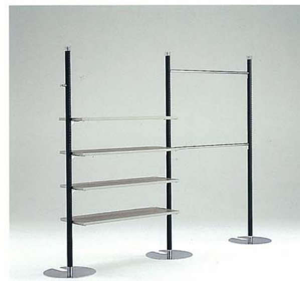
MODEL-3 本体 スチール・塗装 黒,Crメッキ/ハンガー スチール・Crメッキ/ 棚 木・染色グレー W3000 D400 H2140