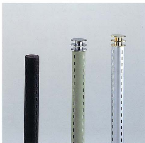
リッター塗装 黒 スウェード塗装 グレー Crサンドプラストメッキ