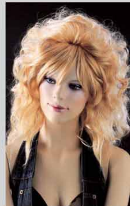
FORT 30 オーダーメイクサンプル (肌色N21) カツラ (オーダーサンプル)