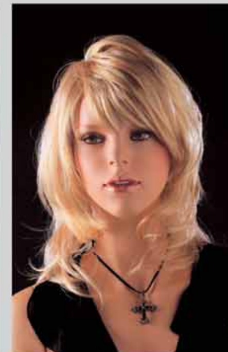
FORT 27 オーダーメイクサンプル (肌色N5) カツラ (オーダーサンプル)