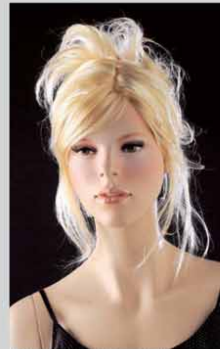
FORT 27 スタンダードメイク (肌色N21) カツラ (オーダーサンプル)

本カタログのスタンダード仕様のメイクは、通常レンタル料金に含まれます。 カツラはオーダーサンプルとなっています。その他、ご要望に応じてメイクと カツラの制作を別途料金にて承っておりますので、ご相談ください。