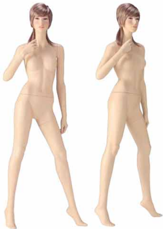
FORT 27(D) 高さ 178.0 / B83.0 / W56.0 / H86.0 右腕 RFORT27B / 右手先 RWE 左腕 LFORT27A / 左手先 LW15