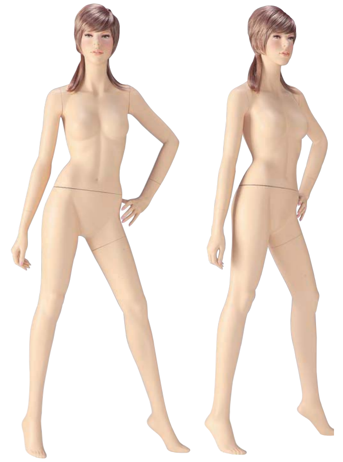
FORT 27(C) 高さ 178.0 / B83.0 / W56.0 / H86.0 右腕 RFORT27A / 右手先 RW16 左腕 LFORT27B / 左手先 LWE