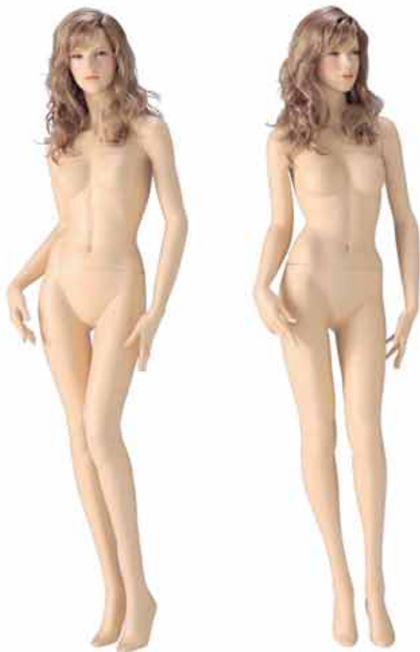
FORT 29 高さ 177.5 / B82.0 / W55.5 / H86.0 右腕 RFORT29 / 右手先 RW2 左腕 LFORT29 / 左手先 LW1