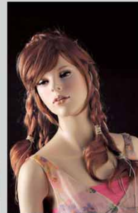
FORT 28 スタンダードメイク (肌色N21) カツラ (オーダーサンプル)