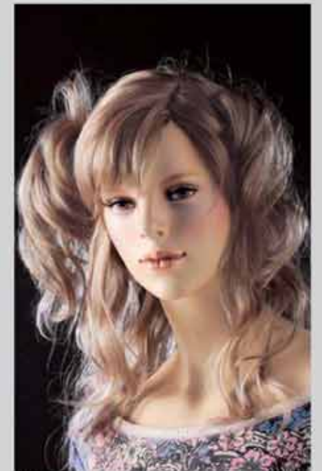
FORT 29 スタンダードメイク (肌色N21) カツラ (オーダーサンプル)