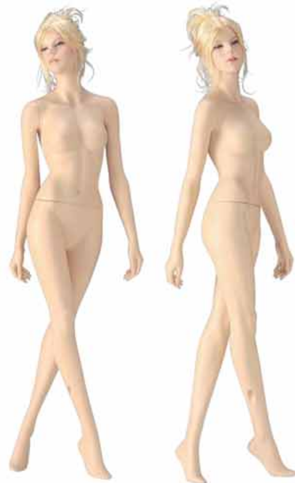
FORT 28 高さ 177.0 / B82.0 / W56.0 / H86.0 右腕 RFORT28 / 右手先 RW16 左腕 LFORT28 / 左手先 LW15