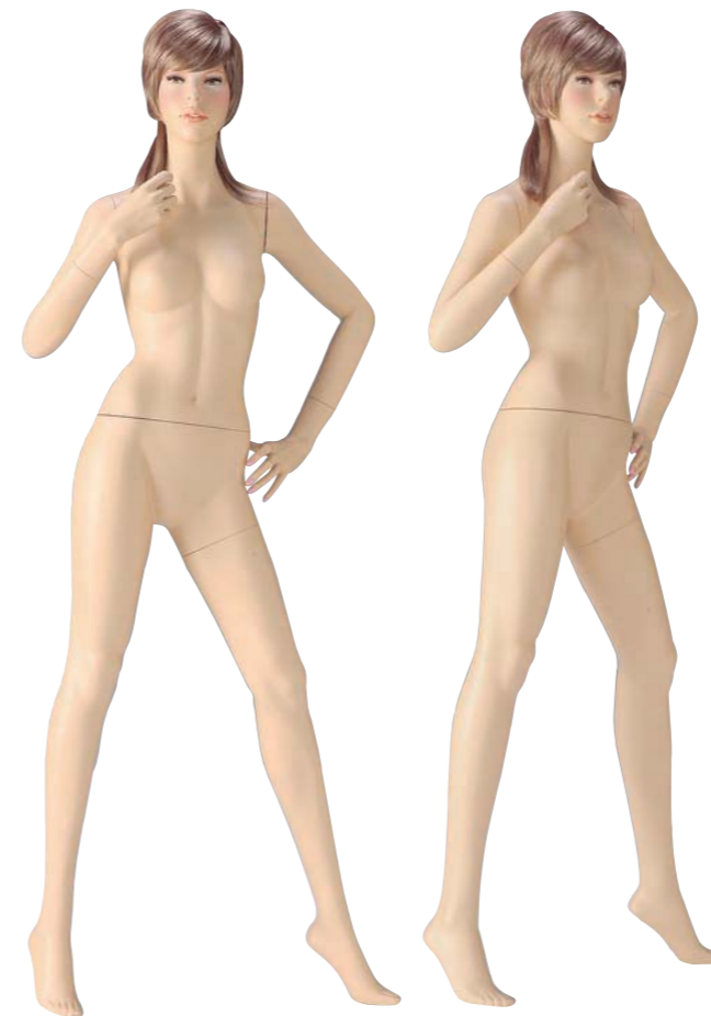
FORT 27(B) 高さ 178.0 / B83.0 / W56.0 / H86.0 右腕 RFORT27B / 右手先 RWE 左腕 LFORT27B / 左手先 LWE