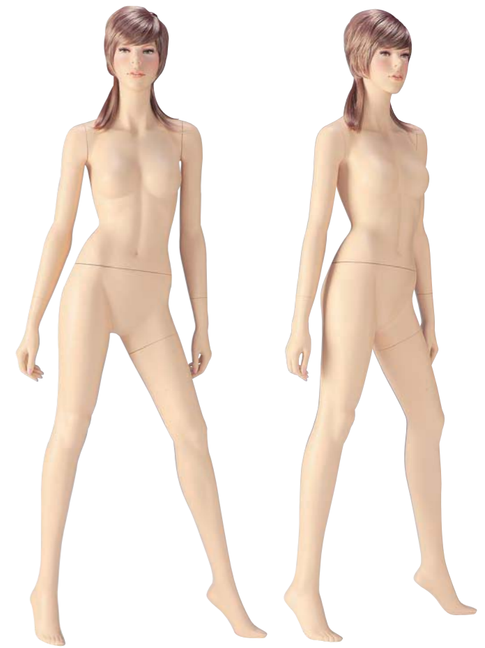
FORT 27(A) 高さ 178.0 / B83.0 / W56.0 / H86.0 右腕 RFORT27A / 右手先 RW16 左腕 LFORT27A / 左手先 LW15