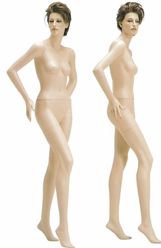
FORT 15V 高さ 180.0 / B 82.0 / W 61.5 / H 88.0 右腕 FORTE 15 / 右手先 PW 6 左腕 FORTE 15 / 左手先 PW 6