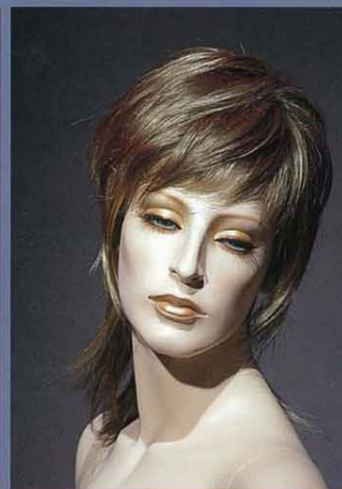
FORT 14V スタンダードメイク B・カツラ (オーダーサンプル)