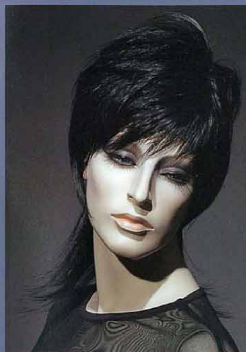
FORT 14V スタンダードメイク A・カツラ (オーダーサンプル)

本カタログのスタンダード仕様のメイクは、通常レンタル料金に含まれます。カツラはオーダーサンプルとなっています。この他、ご要望に応じてメイクとカツラの制作を別途料金にて承っておりますので、ご相談ください。