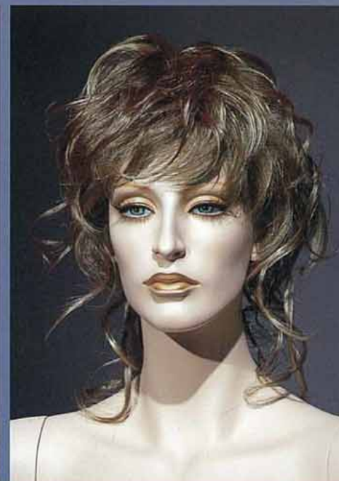
FORT 16V スタンダードメイク B・カツラ (オーダーサンプル)