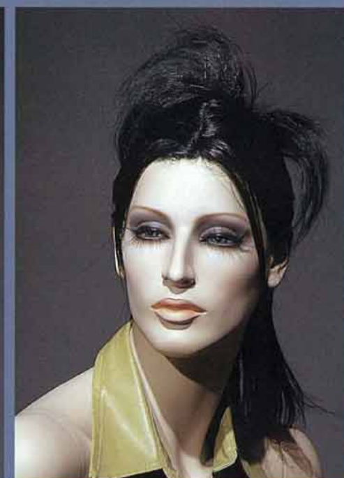
FORT 15V スタンダードメイク A・カツラ (オーダーサンプル)