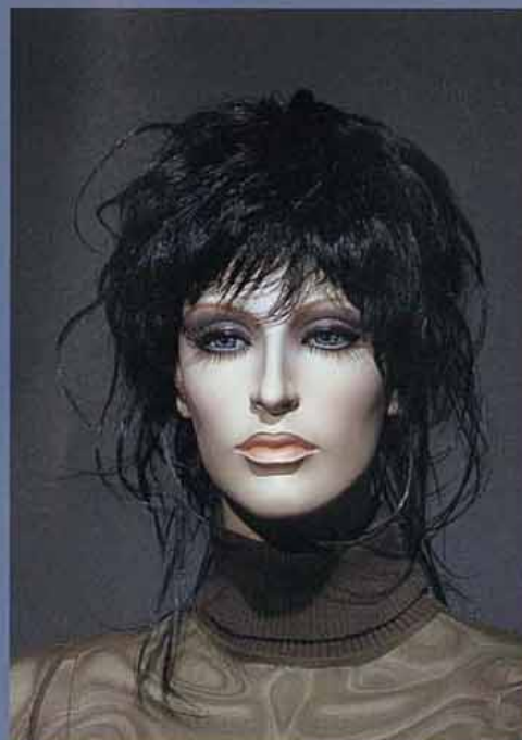
FORT 16V スタンダードメイク A・カツラ (オーダーサンプル)