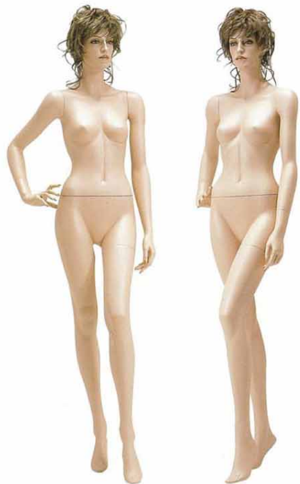
FORT 16V 高さ 181.0 / B 81.0 / W 58.5 / H 88.0 右腕 FORTE 16 / 右手先 PW A 左腕 FORTE 16 / 左手先 PW 15