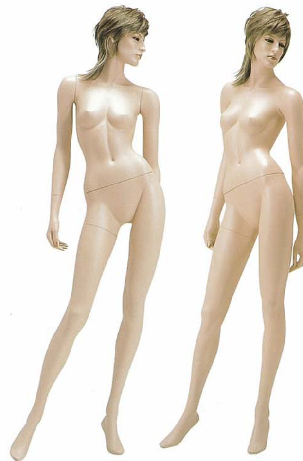
FORT 14V 高さ 179.0 / B 79.0 / W 57.0 / H 86.5 右腕 FORTE 14 / 右手先 PW 16 左腕 FORTE 14 / 左手先 PW 15